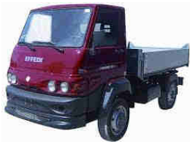
Gasolone / Metanole